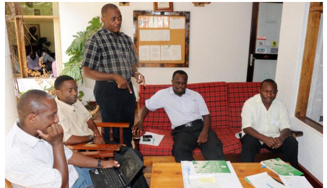
Wergroep Kondoa – het potentieel van ICT voor het LED Programma

Een rapport werd gepresenteerd met daarin de eerste bevindingen en aanbevelingen. In werkgroepen hebben we de LED belangengroepen in kaart gebracht en de manier waarop deze nu functioneren. Ook hebben we ons gebogen over het potentieel van ICT voor LED.