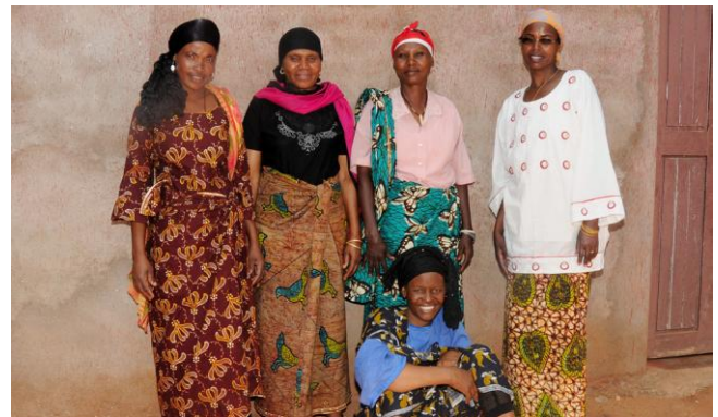
5 dames van het zonnebloemproject

Zondag brachten wij een bezoek aan ons dorp Kiteo. We hadden een ontmoeting met de vrouwen van het zonnebloemproject die trots vertelden dat zij een enorm goede oogst hadden gehad. Van de winst hadden vrouwen o.a. een stuk land gekocht, een geit en hun kinderen naar de Secondary School gestuurd. Om geld achter de hand te hebben als de oogst een jaar minder goed uitpakt, is besproken dat niet alle winst meteen wordt verdeeld onder de dames, maar dat zij de winst deels terug in hun project stoppen.