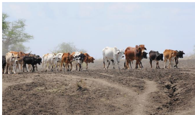
Masai koeien op de Tanzaniaanse steppe

Na aankomst op Kilimanjaro Airport reden wij naar Arusha om te overnachten. Van Arusha was het vervolgens een dag reizen naar Kondoa. Een reis over veelal slechte wegen zonder asfalt met een prachtig uitzicht op het Afrikaanse landschap.