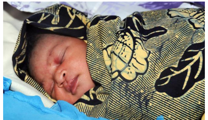
Pasgeboren baby in het ziekenhuis van Kondoa