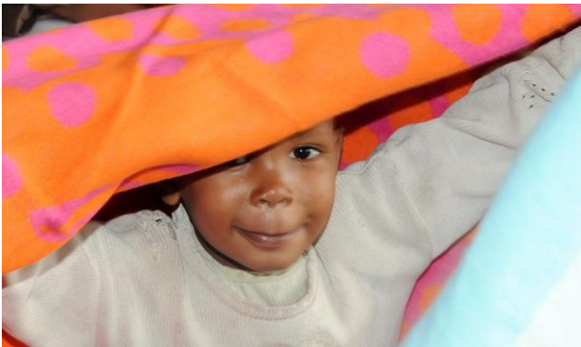
Poloni wees blij met dekentje

De kinderen van Poloni hebben tekeningen gemaakt. Van deze tekeningen zullen wij kaarten drukken. De opbrengst van de kaartverkoop komt volledig ten goede aan het Poloni weeshuis.