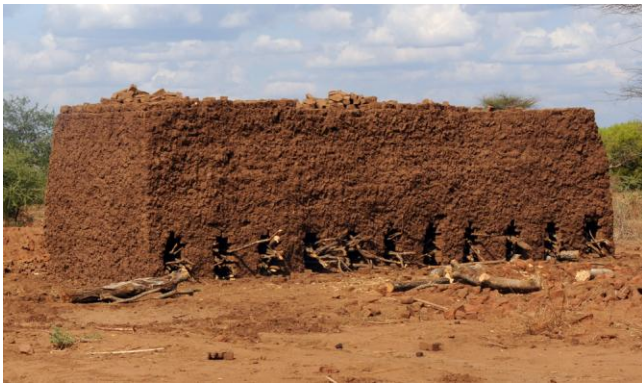
De stenen klaar om gebakken te worden

De Primary School van Kiteo hebben we niet kunnen bezoeken, maar we zijn wel op de plek geweest waar de stenen klaarstonden om gebakken te worden voor de bouw van tenminste 2 klaslokalen dit jaar. Volgend jaar zullen er nog 2 klaslokalen gebouwd worden en mogelijk nog een 5 e lokaal het jaar erop.