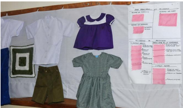
Leslokaal waar kinderen leren naaien en borduren

Dezelfde dag brachten we een bezoek het Munguri Folk Development College; een school waar grotere kinderen een technische opleiding kunnen volgen. Munguri biedt plaats aan 120 leerlingen, waarvan er 100 ook inwonen. De leerlingen leren o.a. naaien en borduren, muren metselen, energiezuinige oventjes bouwen en timmeren. De kinderen in de naaiklas oefenen steken met papier bij gebrek aan stof. De jongens die leren voor timmerman hebben behoefte aan allerhande gereedschap en materialen.