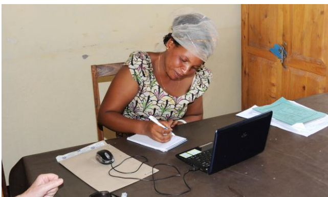
De WEO van Kwamtoro in haar nopjes met de laptop

Tevens maakten we van de gelegenheid gebruik om te zien hoe de dorpen functioneerden waar de WEO een zonnepaneel en laptop had gekregen, teneinde zijn/haar kasboek bij te kunnen houden in Excel. De zonnepaneeltjes bleken diefstalproof op het dak gemonteerd, de laptop wordt 's avonds goed opgeborgen, of gaat mee naar huis. De 10 WEO's die geselecteerd waren voor de laptop en inmiddels diverse trainingen hebben ontvangen zijn dolblij met de technologische vooruitgang. Het gestandaardiseerde formulier helpt fouten te voorkomen en is tijdsbesparend.